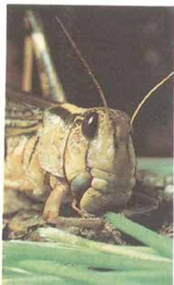
Ուտելիքը մանրելով կը ստանան իրենց սնունդը

Միջատները կը սնանին ուտելիքները մանրելով կամ ծծելով: