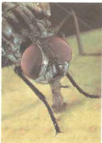
Խայքելով եւ ծծելով կը ստանան իրենց սնունդը