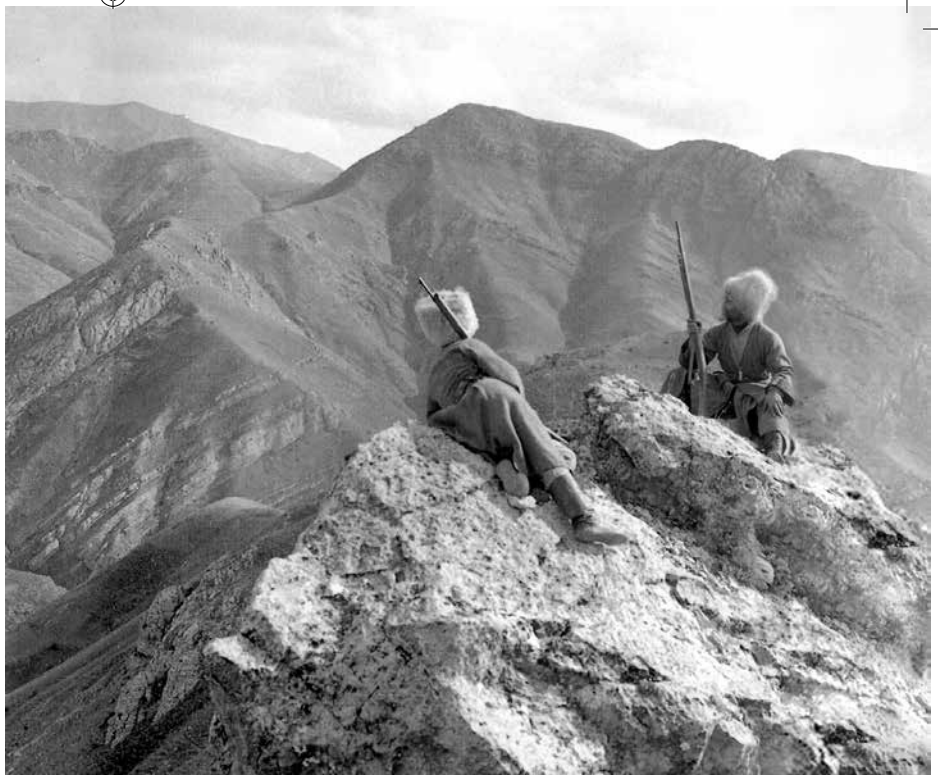
Հսկող պահակներ՝ Սիւնեաց լեռնագագաթներուն վրայ, Խաչիկ գիւղ (հին անձանօթ լուսանկար, 1911)

յաջողուեց մի ուսումով անցնել յետսակողմ 12 , եւ մի երկրորդ ուժգին հարուածով պատառոտել նրա փորը: