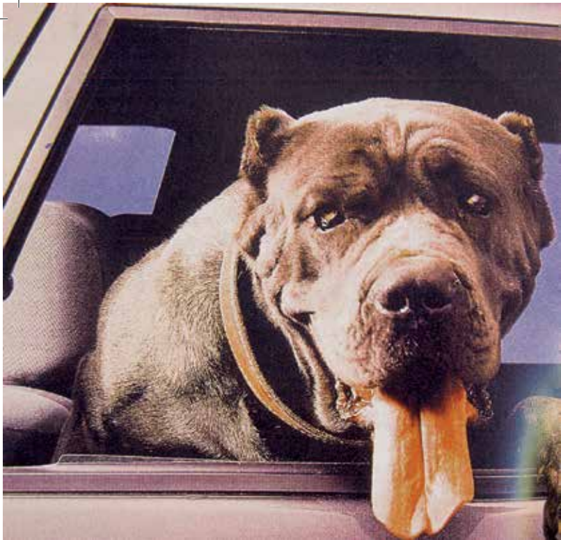
«Բայց հոգին նեղ էր...»

5. Տասը րոպե չէր անցած՝ տղաս ու Հանցը խոհանոց մտան: Տղուս վրայ ակնարկ մը՝ եւ հասկցայ, որ չարաղէտ, ահաւոր բան մը պատահած էր: Դէմքը մուր, հող, քրտինք էր. վարի շրթունքը կը դողար. շապիկին մէկ թելը չկար: Եթէ գիրուկ, կլոր ծնօտը սեղմած չըլլար այոքան ամուր, անպայման պիտի լար: